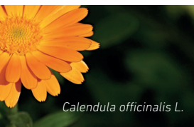
Calendula officinalis L.

FLOR DE SECHUAN: ideal per combatre infeccions estomacals i d'oida i mals de queixal.