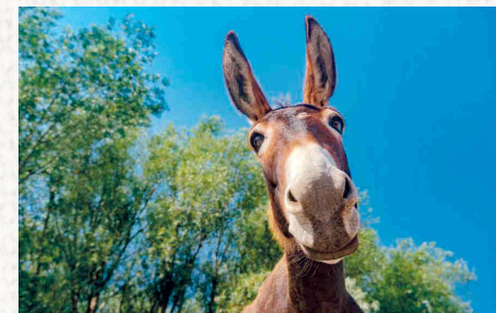
Caravana de ruquets • Preu tiquet: 2€

DURANT TOT EL DIA, ACTIVITATS PER INFANTS I ADULTS