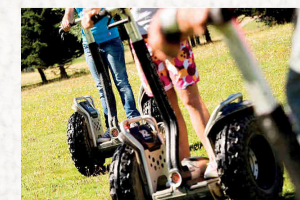
Iniciació al segway. Preu tiquet: 5€ (A partir de 12 anys)