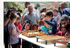
Jocs gegants tradicionals